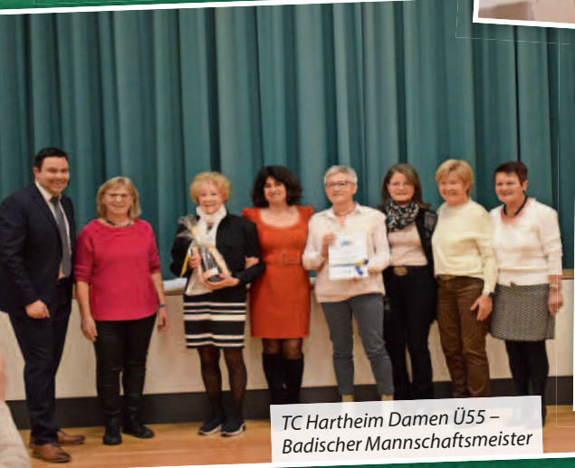
TC Hartheim Damen Ü55 – Badischer Mannschaftsmeister