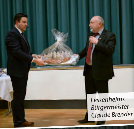
Fessenheims Bürgermeister Claude Brender